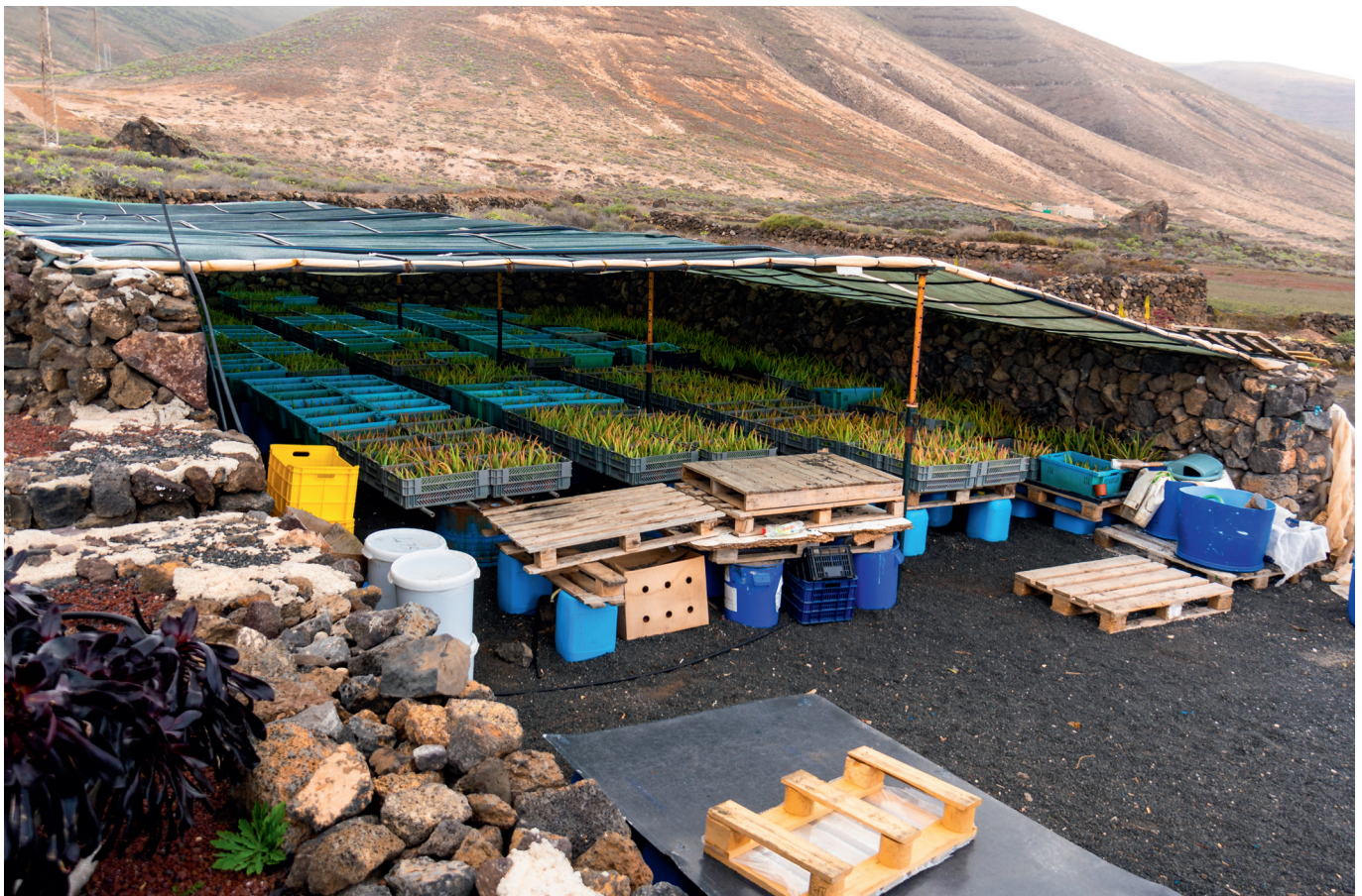
Aufgrund der besonderen Bodenbeschaffenheit und der klimatischen Bedingungen bietet die Insel Lanzarote sehr gute Bedingungen für den Anbau von Aloe Vera